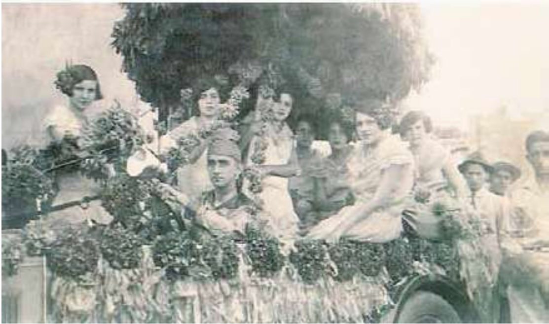
Fig. 4. Bloco canavalesco de Cuiabá, em carro alegórico, déc. 1920.

Tudo tinha início com o levantamento do mastro na Praça da República, em frente à igreja Matriz do Senhor Bom Jesus de Cuiabá, momento de uma festa e alegria.