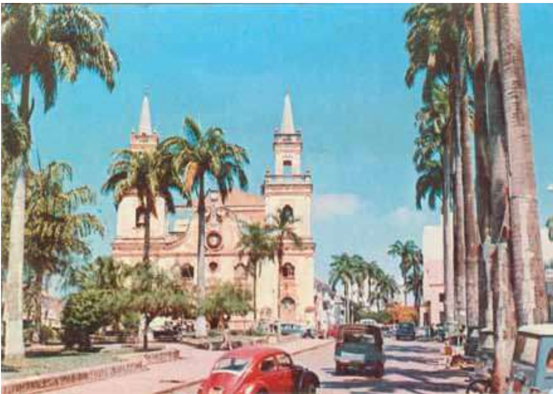
Fig. 5. Centro de Cuiabá. Em primeiro plano, Igreja Matriz, déc. 1970.

Tudo tinha início com o levantamento do mastro na Praça da República, em frente à igreja Matriz do Senhor Bom Jesus de Cuiabá, momento de uma festa e alegria.