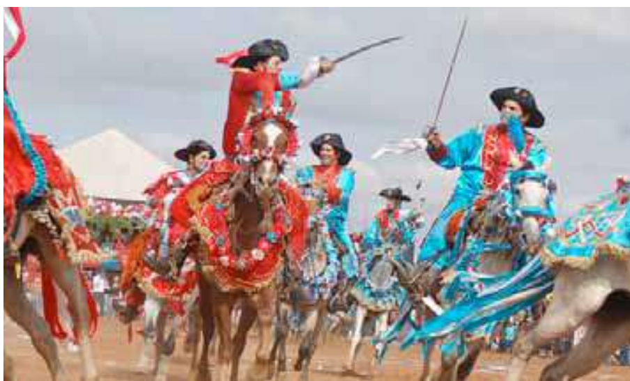
Fig. 3. Cavalhadas de Cristãos e Mouros.

Na cidade pantaneira de Poconé, a tradição da batalha simbólica das Cavalhadas de Cristãos e Mouros e a dança de Mascarados, continuam acontecendo, atraindo um número expressivo de participantes (Fig. 3).