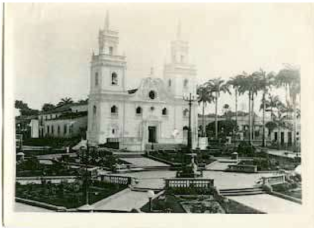
Fig. 2. Igreja e Praça da Matriz, hoje demolida. Década de 1950.

Para comentar o assunto, retomamos em Hall (2003) algumas questões sobre a identidade cultural na modernidade tardia, “as velhas identidades que por tanto tempo estabilizaram o mundo social estão em declínio, fazendo surgir novas identidades e fragmentando o indivíduo moderno, até aqui visto como unificado”. (HALL, 2003, p. 7).