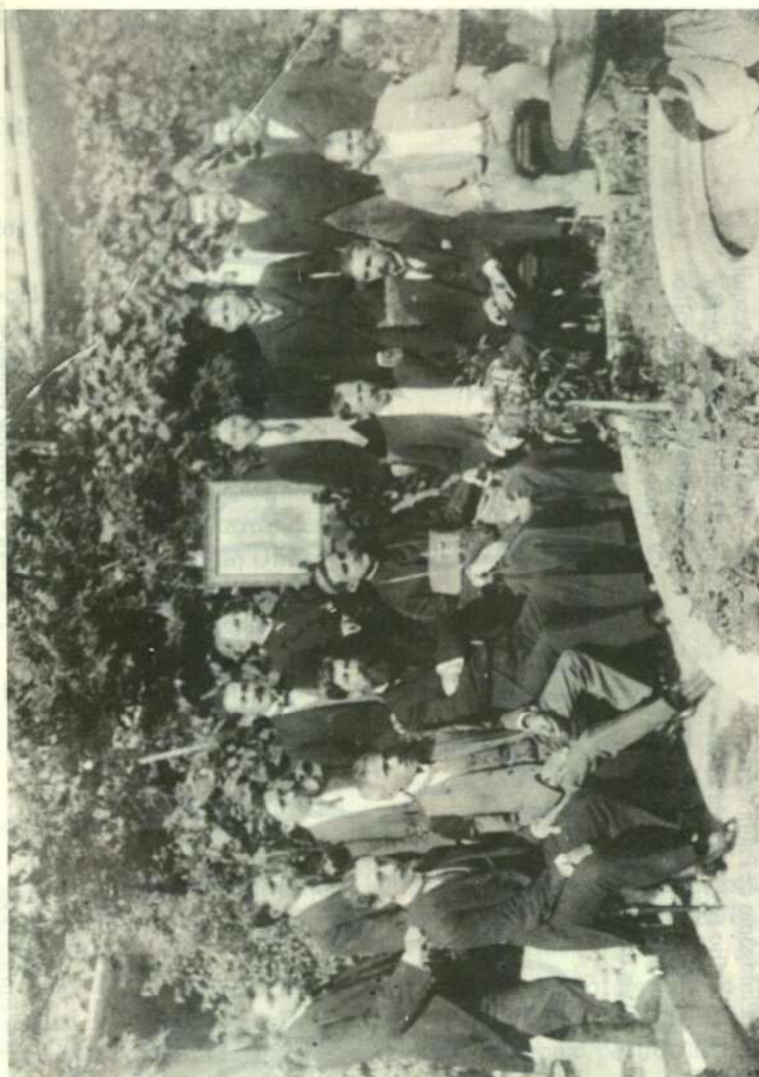
Fotografia tirada na Residência Oficial do Presidente do Estado após a fundação do IHGMT em 1º de janeiro de 1919