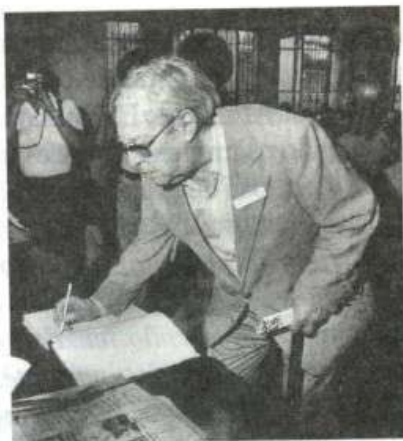
SÉRGIO BUARQUE DE HOLANDA