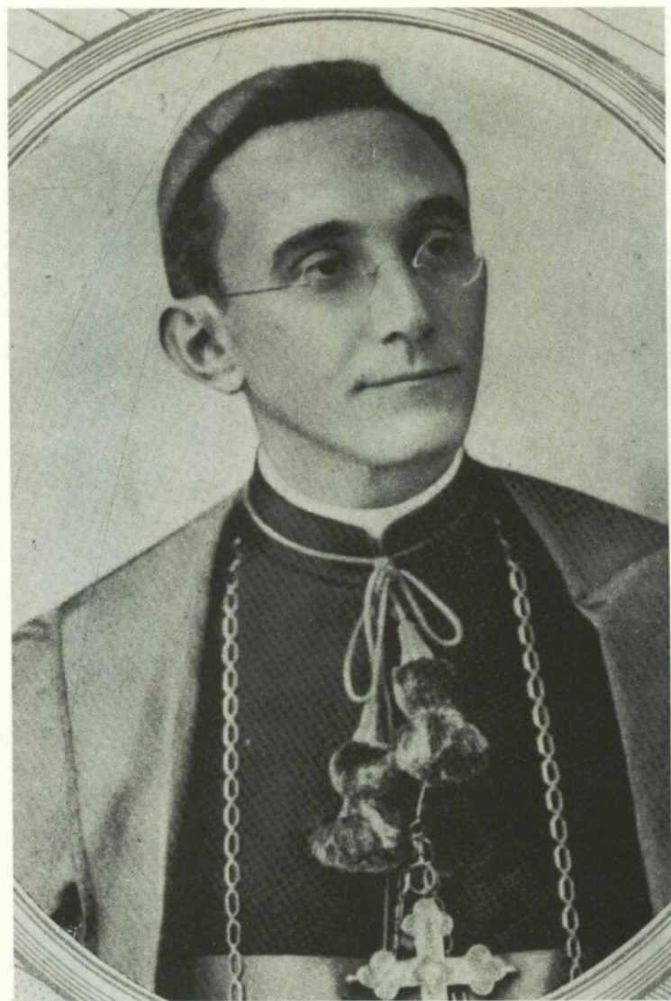
Dom Francisco de Aquino Corrêa 1º de janeiro de 1919 a 23 de março de 1956