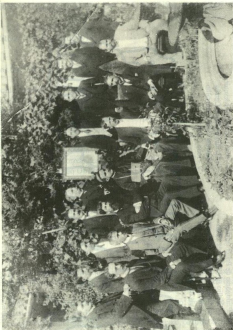
Fotografia tirada na Residência Oficial do Presidente do Estado após a fundação do IHGMT em 1º de janeiro de 1919