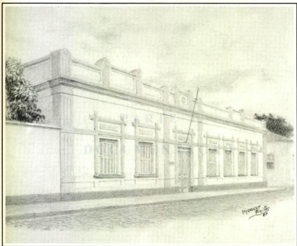
Casa Barão de Melgaço - Séde do Instituto Histórico e Geográfico de Mato Grosso (Gravura de Moacir de Freitas)